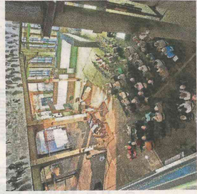
Bislang gab es für Gäste des Flusskreuzfahrtschiffes 40 Konzerte im Peenemünder Museum.

Weitere Infos online unter: https://museum-peenemuende.de/veranstaltung/fluchtgeschwindigkeiten-von-planetenraumen-und-all-machtstraumen